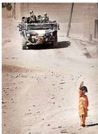
Nederlanders in Afghanistan.

Het is goed dat we terugkeren naar Afghanistan.