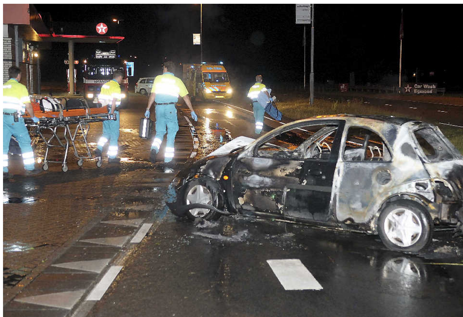
Bij ernstige nachtelijke verkeersongevallen, zoals hier op de Heilooër Zeeweg in Egmond aan den Hoef, is de inzet van de traumaheli gewenst.

Heel de afgelopen jaren geleden berichtte het Noordhollands Dagblad over een TNO-rapportage over verspreiding van reststoffen van gewasbeschermingsmiddelen in de lucht. Dat onderzoek gaf toenmalig minister van landbouw Veerman, minister Hoogervorst van Volksgezondheid en staatssecretaris Van Geel van milieu géén aanleiding voor verder onderzoek. Voorzitter Langeslag van de landelijke vereniging van bollentelers (KAVB) denkt dat een onderzoek op dit moment een herhaling van zetsen wordt. Hij voelt zich daarin gesteund door een recente uitspraak van de Raad van State. „De gemeente Heerenveen wilde een bollenteeltvrije zone. Maar hun bezwaren zijn verworpen. De Raad van State had zich daarbij gebaseerd op rapportages van deskundigen.”