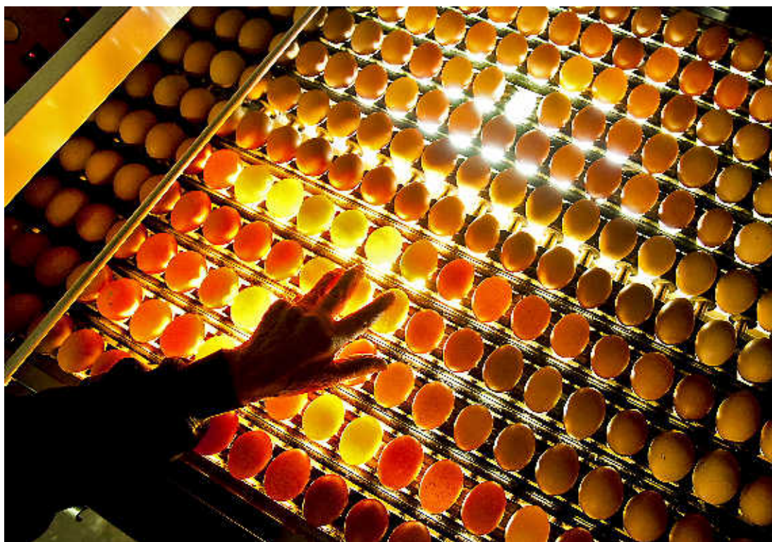
Eieren selecteren in Barneveld.

De speciale supportersactie geldt overigens ook voor de tweede seizoenshelft.